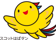
兵庫県マスコットはほたん

ミドル世代を積極的に正社員採用している兵庫県内の企業が参加する合同企業説明会を開催します。 経験者を求める求人から経験不問の求人まで、様々な業種の求人と出会うチャンスです。 新しい仕事にチャレンジしたい概ね35歳以上56歳以下の方の参加をお待ちしております。